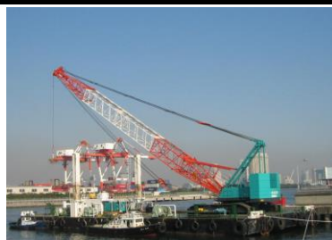
『100隻の作業船と水の職人集団』 これが当社のメインテーマです。