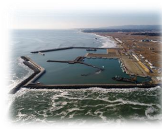
東日本大震災の災害復旧にも 貢献しています。