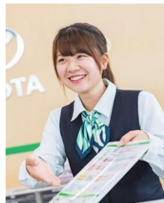
レンタカースタッフ・総合営業スタッフ仕事風景