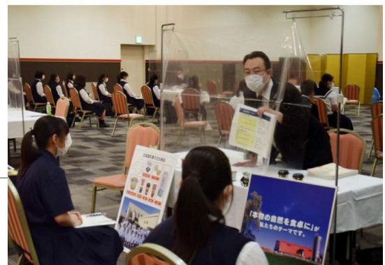
図1：企業ブースのビニールシート設置イメージ