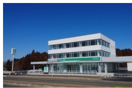
本社・茨城空港店新社屋