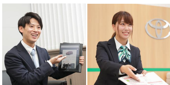
レンタカースタッフ・総合営業スタッフ仕事風景