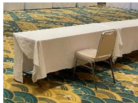
図2：テーブルクロス