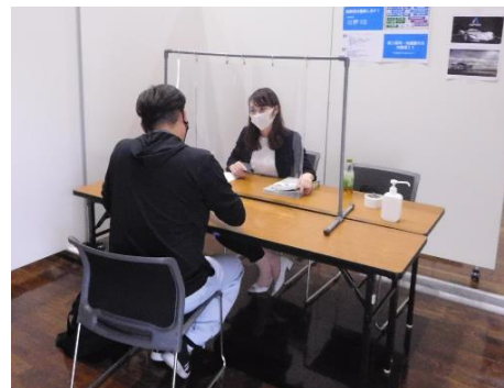
図1：企業ブースのビニールシート設置イメージ