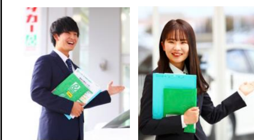
レンタカースタッフ・総合営業スタッフ仕事風景