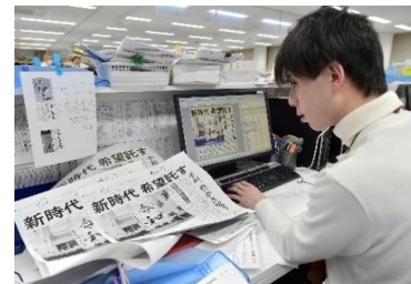
紙面レイアウト作成中