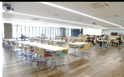
(土浦事業所 カフェテリア) ランチの他、打合せや会社説明会等でも利用します