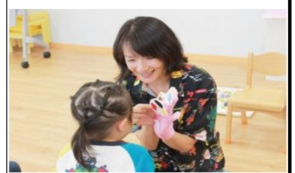
児童から高齢者まで、 幅広い分野の福祉を展開しています