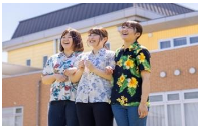
南国リゾート風のきれいな建物で ユニフォームにアロハシャツを採用！