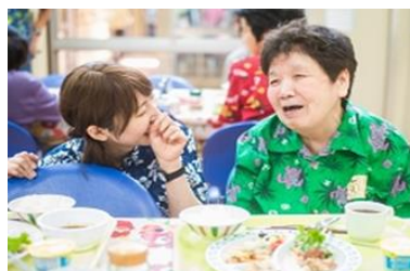
利用者さんも職員も「笑顔」を 大切にしています。