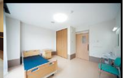
桜陽だまり館 施設内