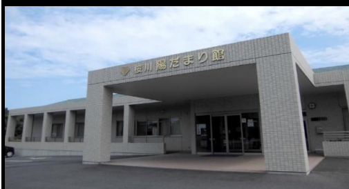
桜川陽だまり館 建物外観