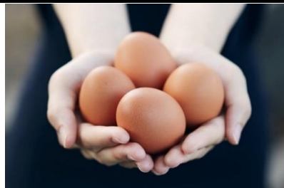
農場の美味しい卵を皆様の食卓に