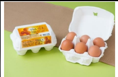
大人気の平飼いたまご