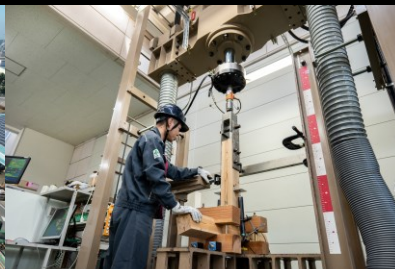
住宅耐震金物の開発作業風景です。