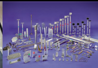
住宅資材の製品です。