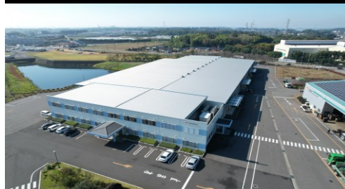
住宅資材部門つくば工場です。情報メディア部門は江戸崎、選挙ディスプレイ部門は霞ヶ浦に工場があります。