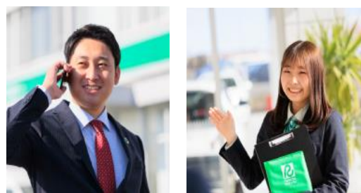
リース総合営業スタッフ仕事風景