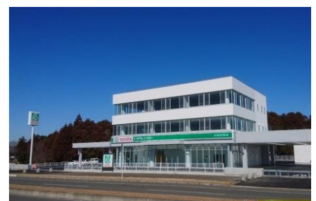
本社・茨城空港店新社屋