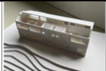
模型や提案書の作成