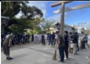
毎月末の日曜日、朝の鹿島神宮清掃奉仕活動