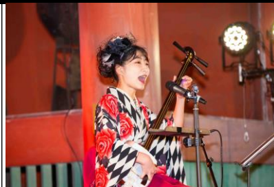
まちイベ、Meet to Artの実施