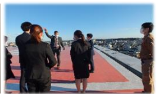
昨年実習のようす