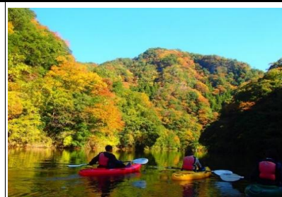
竜神峡アウトドアフィールド店ツアー