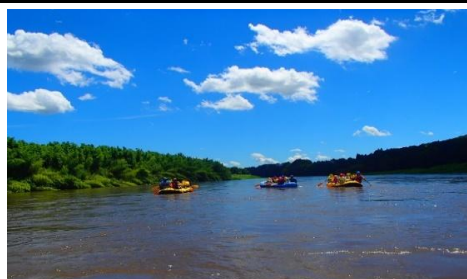
那珂川店 ラフティングツアー