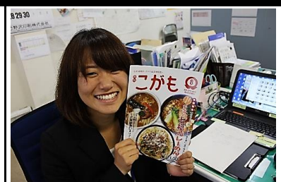
女性の営業社員も多数活躍中！