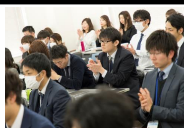
営業会議は情報共有の場 切磋琢磨の時間です