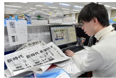
紙面レイアウト作成中