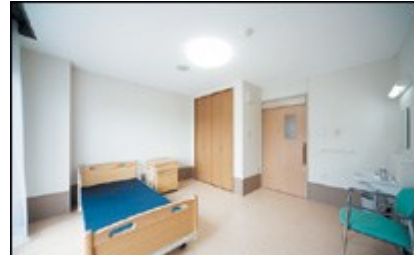
桜陽だまり館 施設内