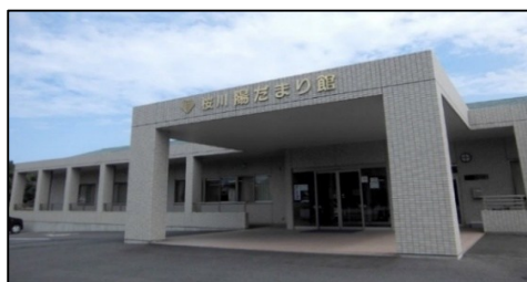
桜川陽だまり館 建物外観