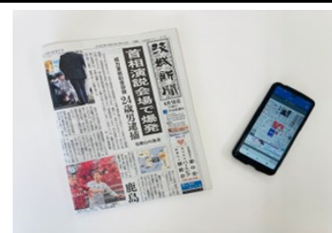
茨城新聞と茨城新聞電子版