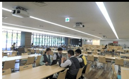
(土浦事業所 カフェテリア) ランチの他、打合せや会社説明会等でも利用します