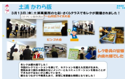
レクリエーションを実施しました！ 年2回実施しており、全力で楽しみます！