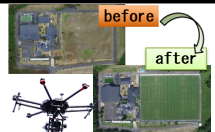
ICT「i-construction」 ドローンをを用いた 3次元測量