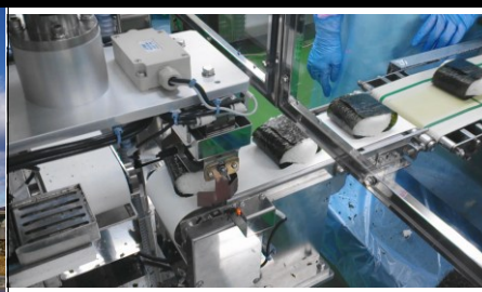
おにぎり海苔巻き装置