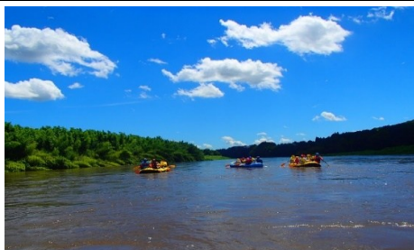
那珂川店 ラフティングツアー